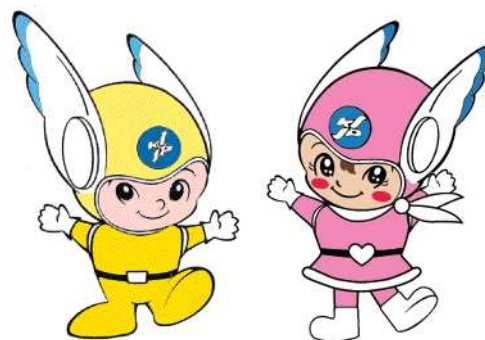
神奈川県警察シンボル・マスコット 「ピーガルくん」・「リリポちゃん」