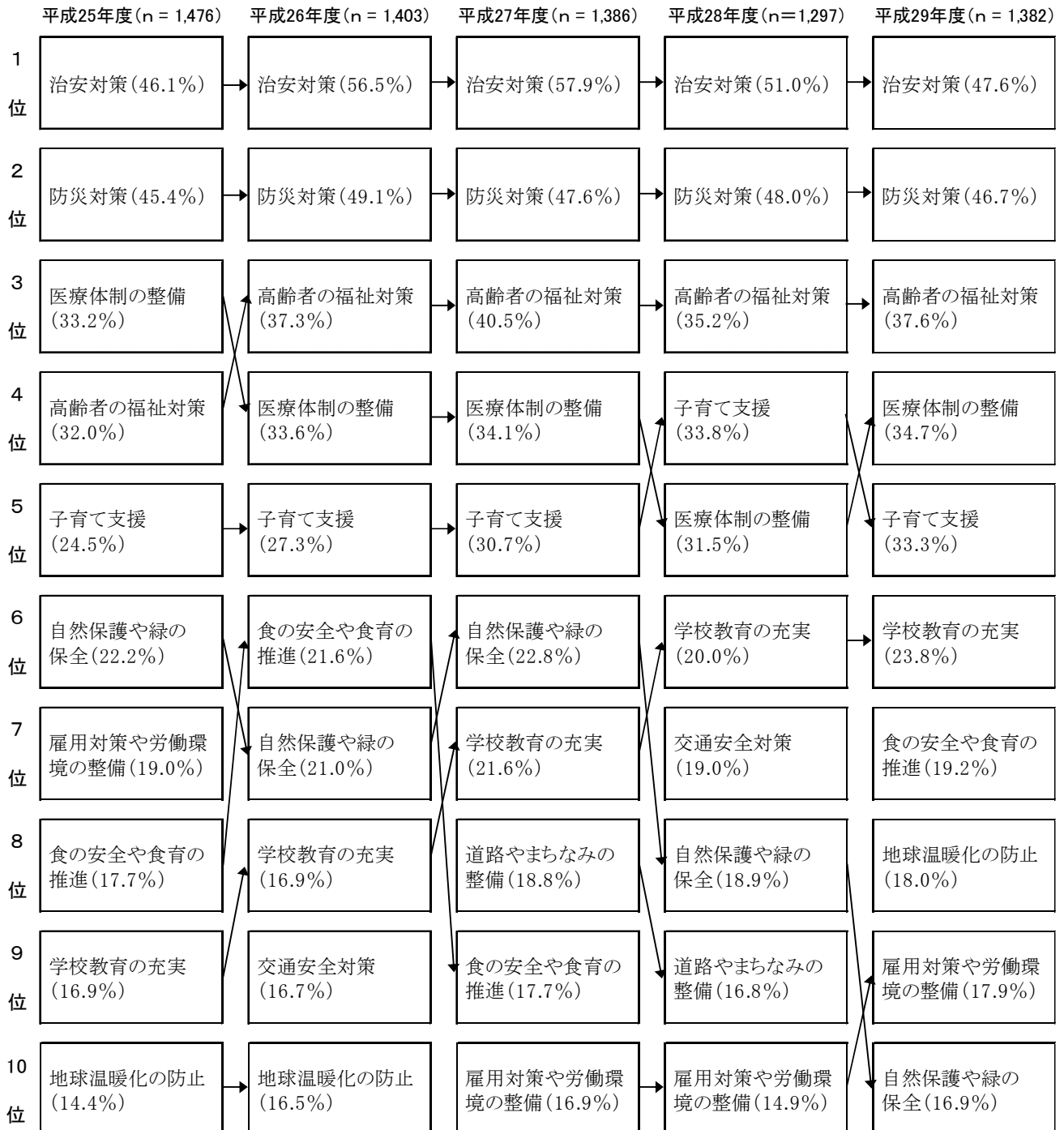
図表4-2 県行政への要望（上位10項目）（複数回答）－過去との比較

過去4年間の調査と比較すると、上位5項目は、若干の順位変動はありつつも、平成25年度以降同じ項目となった。(図表4-2)