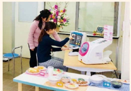
未病センターかまくら