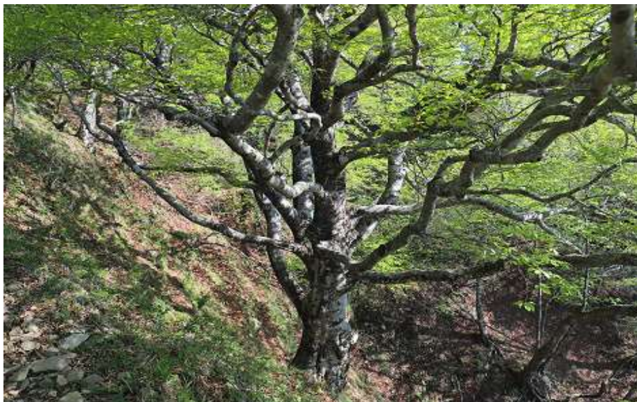
丹沢の緑 プナの大木(表尾根のプナ林の緑) 新大日付近