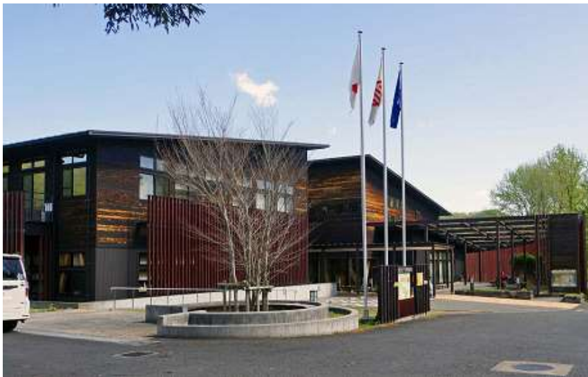
総会会場 神奈川県自然環境保全センター(厚木市七沢)