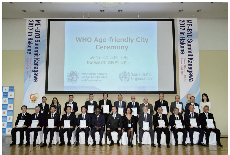
Ceremony for the certificate of membership in the WHO GNAFCC

エイジフレンドリーシティは、WHO が立ち上げた高齢者に優しい地域づくりに取り組む自治体等の国際的なネットワークです。日本からエイジフレンドリーシティに参加する 24 自治体のうち、神奈川県から 22 市町が参加しています。県は自治体間の情報共有や、高齢者に優しい地域づくりを支援する「アフィリエイト」として、各自治体のエイジフレンドリーシティ行動計画の翻訳など言語面の支援や、自治体の健康な高齢化に向けた取組の海外発信支援を行っています。多くの海外自治体や、WHO や世界銀行などの国際機関が県内エイジフレンドリーシティを訪れています。