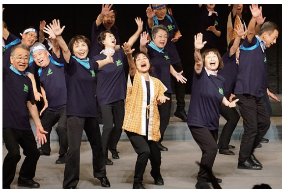
Senior theater in Kanagawa