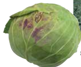
流通規格外のキャベツ