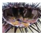
「磯焼け」の海で育ったムラサキウニ。神奈川県で最も多くみられるウニですが、餌(海藻)がないため可食部である生殖巣が育ちません。