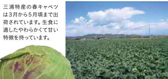
三浦特産の春キャベツは3月から5月頃まで出荷されています。生食に適したやわらかくて甘い特徴を持っています。