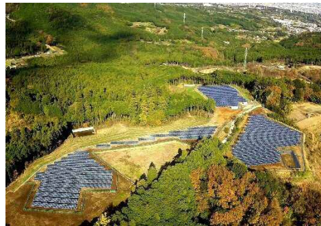
再生可能エネルギーの取組