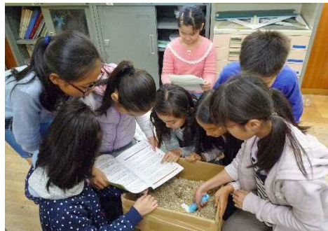
段ボールコンポストの取組