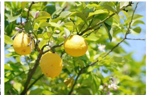
農産物のブランド化