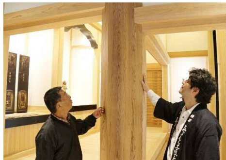
「木づかい」のまちづくり