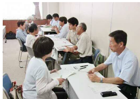
プロダクティブ・エイジングの推進