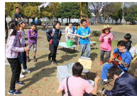
プレイパークの取組