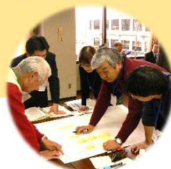
地域コミュニティ