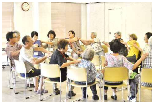
ケアタウンの推進