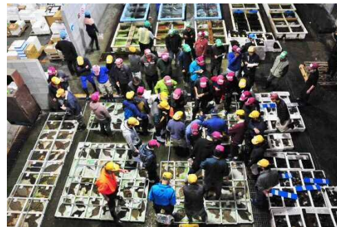
水産物の地産地消