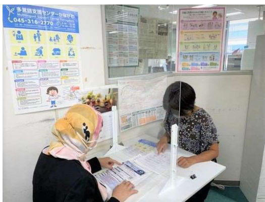
多言語支援センターかながわ