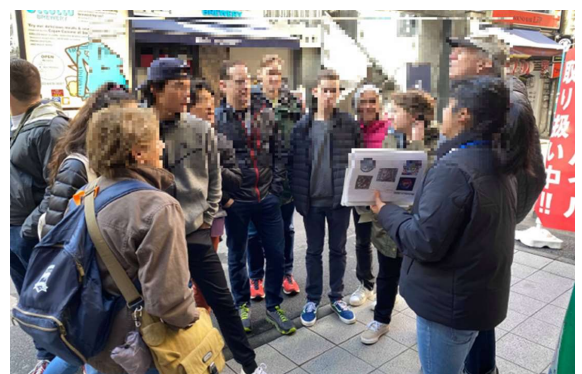
⑭かながわ認定観光案内人 (イメージ)