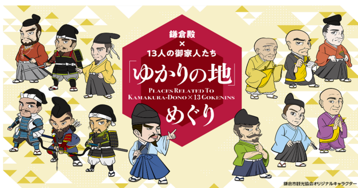
⑦大河ドラマ特設ウェブページ