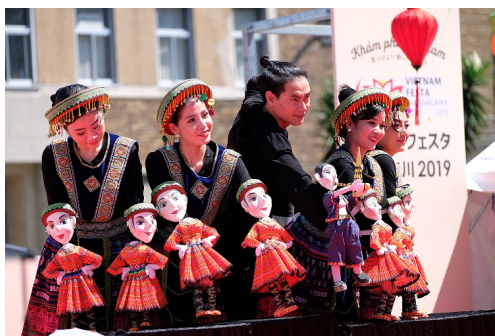
ベトナムフェスタ in 神奈川 2019