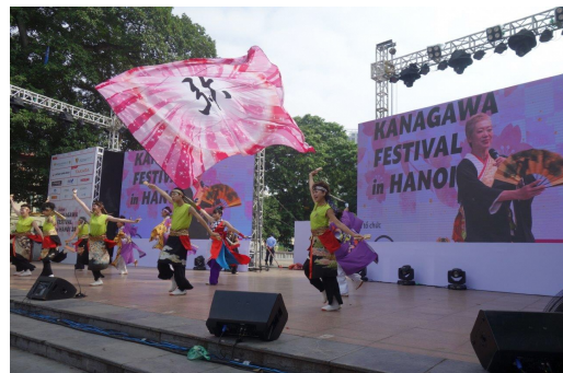
KANAGAWA FESTIVAL in HANOI 2019