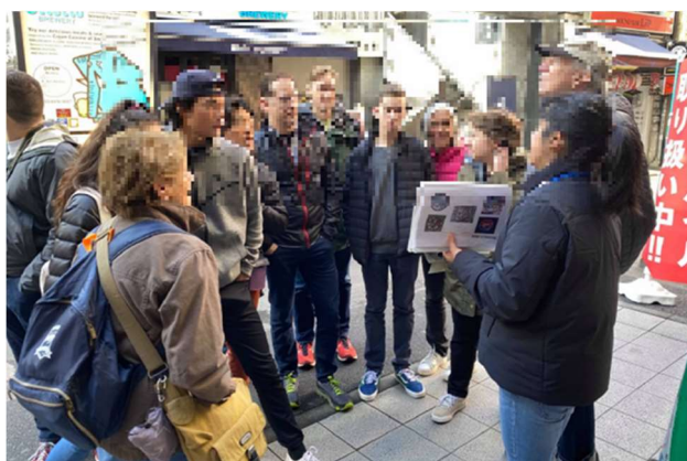
かながわ認定観光案内人 (イメージ) (Official Kanagawa Tour Guide)

講座を受講し、外国人観光客向けの旅行商品を企画・販売した者について、専門家や有識者による審査を経て「かながわ認定観光案内人 (Official Kanagawa Tour Guide)」として認定する。