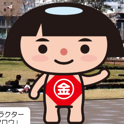
神奈川県PRキャラクター 「かながわキンタロウ」