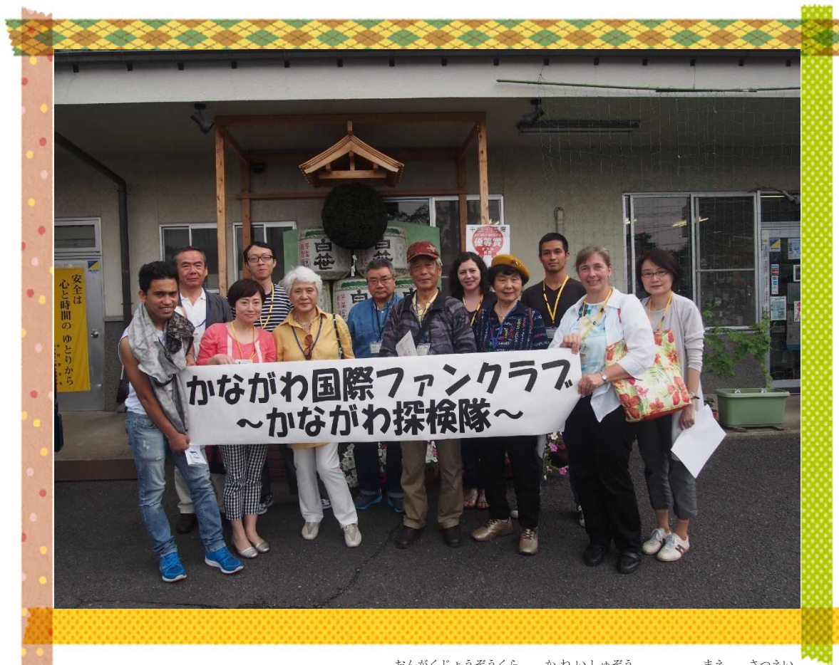
おんがくじょうぞうくら かねいしゅぞう まえ さつえい 音楽醸造蔵 金井酒造さんの前で撮影

かながわけん かんこうち しせつ など けんがく かいじん みな かながわ みりよく 神奈川県 の 観光地 や 施設等を見学し、ファンクラブの会員の皆さんに、神奈川の魅力に ちよくせつ ふ たんけんたい こんかい たんけんたい めい みな 直接接触していただく「かながわ探検隊」。今回の探検隊は、12名のファンクラブの皆さんと おんがく にほんしゅ たんのう たび ちゅうごく クラシック音楽と日本酒を堪能する旅です！中国、ドイツ、ネパール、メキシコ、スペイン かいじん にほんじん かいじん みな さんか の会員と日本人のサポート会員の皆さんに参加していただきました！