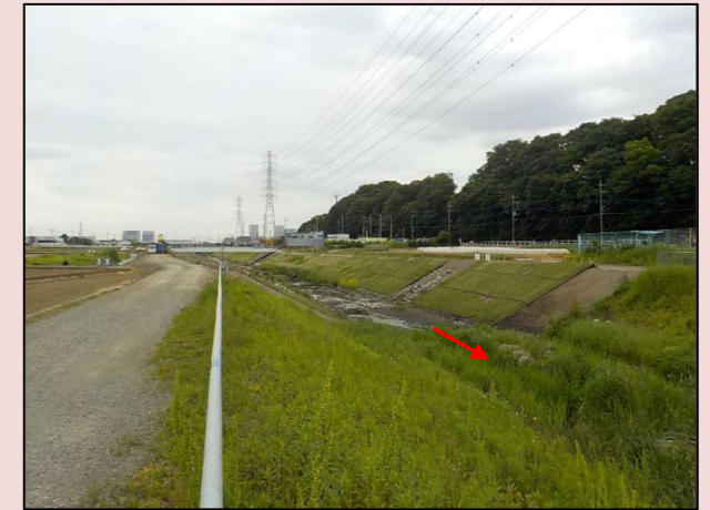
改修後の状況(80号橋付近)