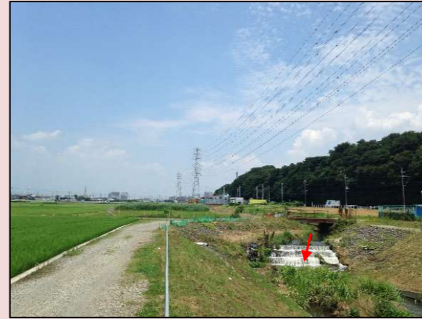
改修前の状況(80号橋付近)