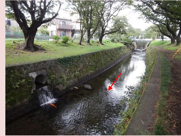
改修前の状況(福田6号橋下流)

現在は、千本桜が並ぶ「福田 8 号橋」から「新道下大橋」までの区間の護岸整備を進めています。