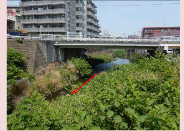
改修前の状況(新道下大橋下流)