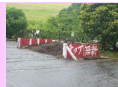
↑このような置き場です