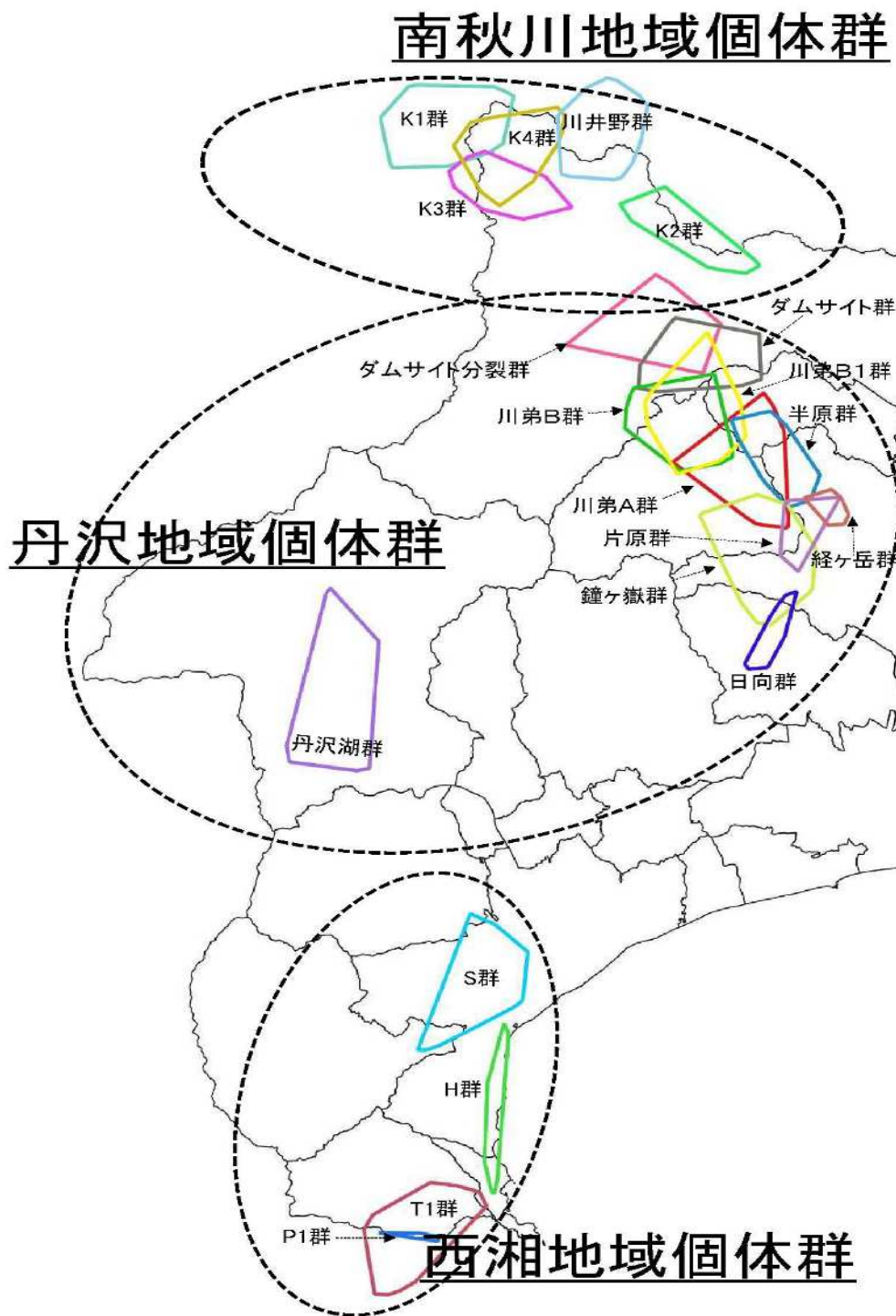
図2 令和2年度加害群の行動域

加害群について、ラジオ・テレメトリー法及びGPS発信器により行動域調査を実施した。行動域及び近年の変化は次のとおりであった。