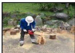
間伐材を活用した製品の製作

※特別対策事業とは、「かながわ水源環境保全・再生実行5か年計画」に定める事業です。詳しくはホームページをご覧ください。