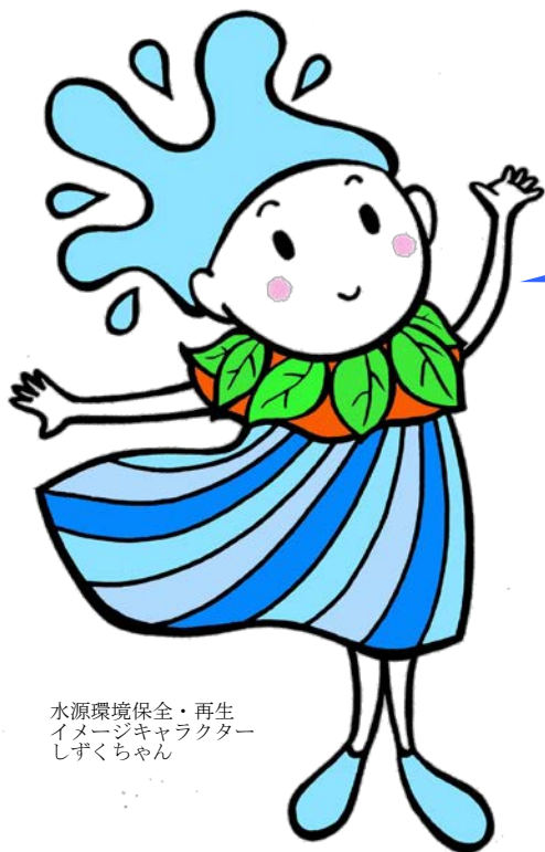
水源環境保全・再生 イメージキャラクター しずくちゃん