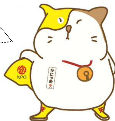
「かにやお」は、NPO認知度向上を目的とした神奈川県のイメージキャラクターです。