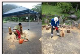
間伐材を活用した製品の製作