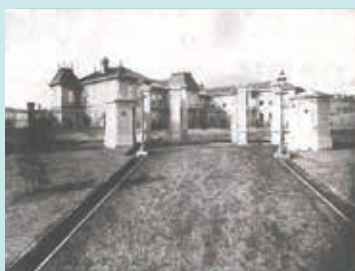
かつての箱根離宮