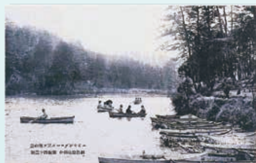
大正時代の三ツ池 船遊びの様子