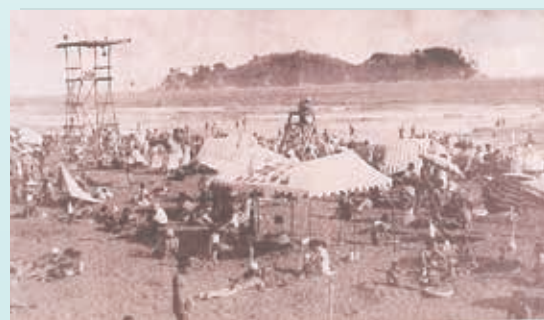
公園完成前の鵠沼海水浴場（1940年頃）