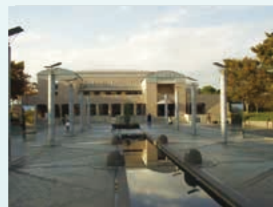
かながわアートホール (保土ヶ谷公園)