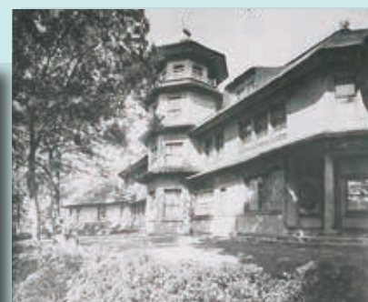
大磯の旧財閥別荘 城山荘