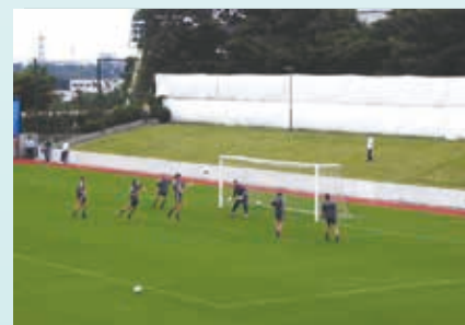
2002年ワールドカップでのドイツチーム練習風景 (保土ヶ谷公園)