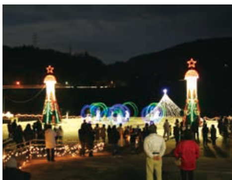
澄んだ夜空にきらめく灯り （相模湖やまなみイルミネーション（12月））