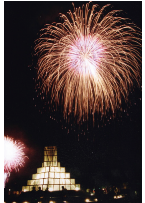
湖面に響く大迫力の音と振動 （さがみ湖湖上祭（8月））