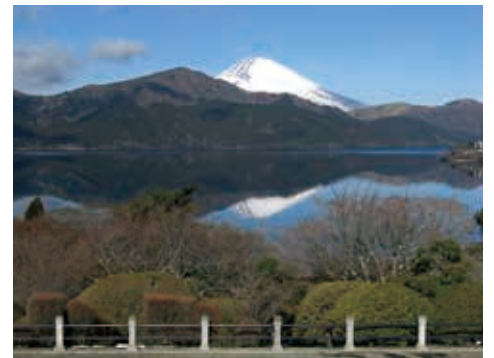
芦ノ湖と富士・箱根連山の見事な眺望