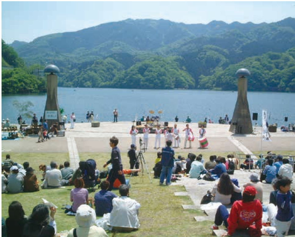
一年を通じた湖畔のイベント（相模湖やまなみ祭（4月））

1938年、相模ダムの工事用地を利用して公園に整備され、1964年の東京オリンピックではカヌー競技場となりました。その後1998年の「かながわ・ゆめ国体」の開催をきっかけに、現在の形に再整備されました。開放感あふれる湖面とそれを取り巻く山々の緑を背景に、観光による地域活性化の拠点となっています。