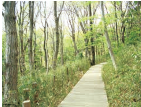
クヌギやシラカシ、野鳥の観察ができる