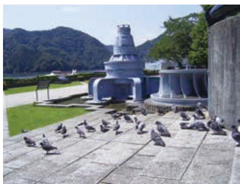
水力発電の歴史を伝える発電機モニュメント