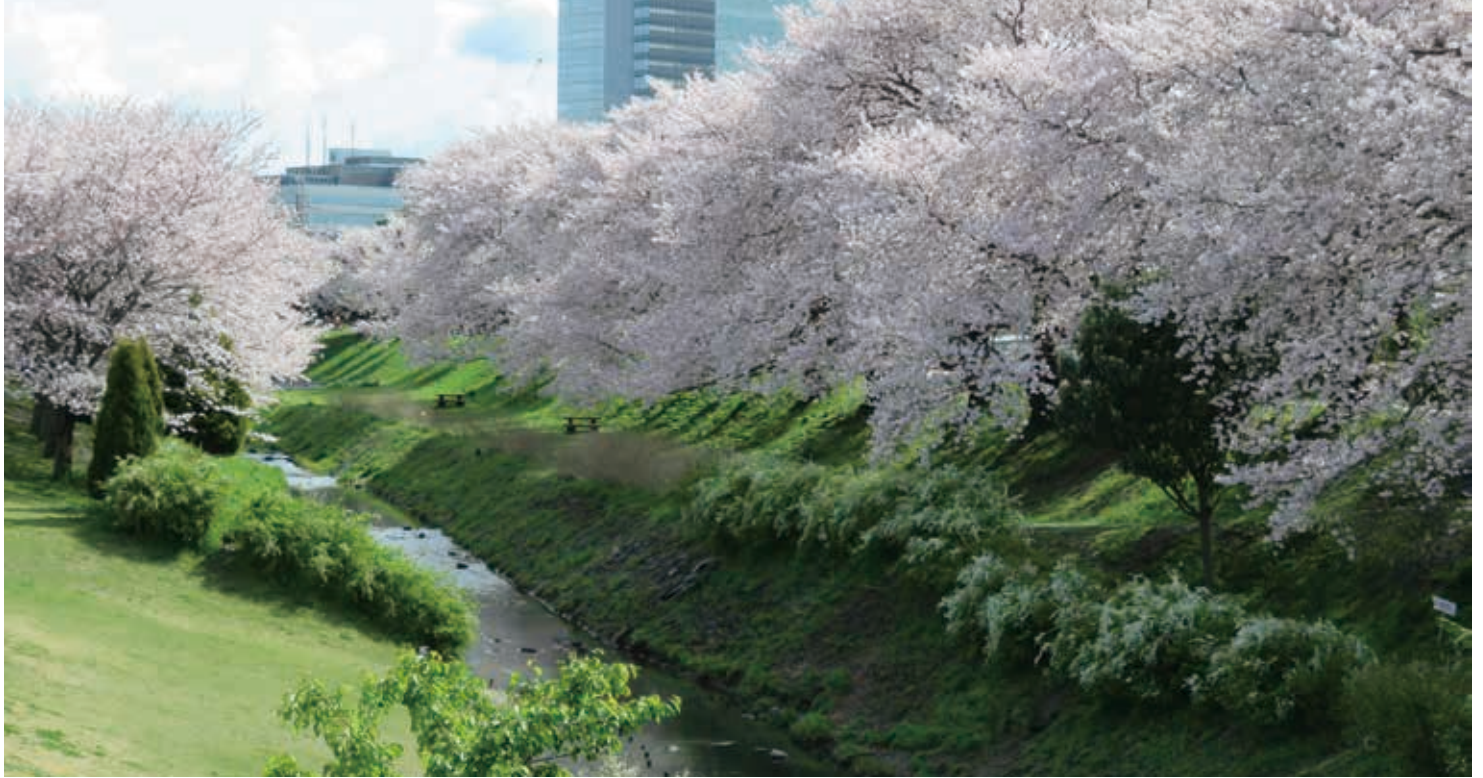
川沿いには桜並木が続く

県の中央部を流れる相模川・中津川・小鮎川の合流地点上流部に位置する河川敷の公園です。園内には大型遊具、芝生広場、パークゴルフ場、健康遊具、野球場があり、川沿いの桜並木の景観が見事です。一年を通してイベントでにぎわいます。