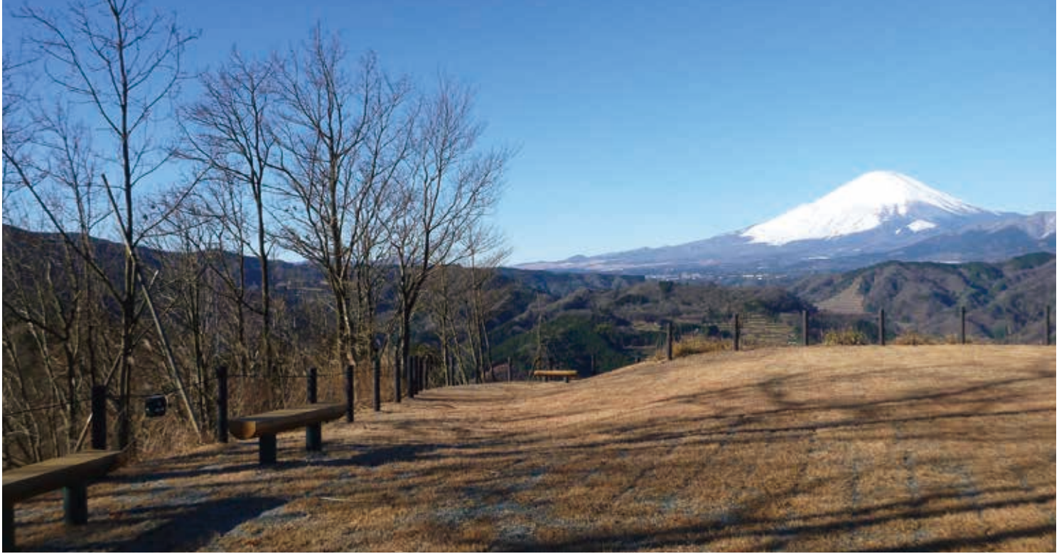
さくら山展望広場からの富士山

つつじ山展望広場は、戦国時代に「鐘ヶ塚砦跡」があったとされ、県指定史跡河村城跡を眼下に見ることができます。