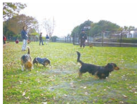
人と犬の遊び場、ドッグラン