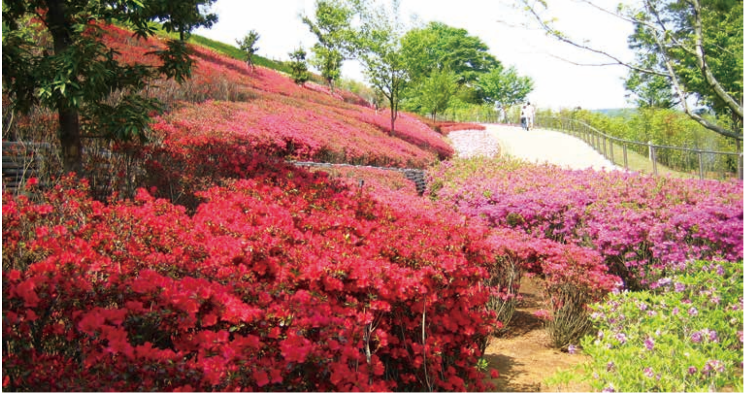
春のツツジ (花の斜面)

宮ヶ瀬ダムの直下にある樹林地を利用した広い公園です。ダム建設の施設跡地などを公園として整備しました。園内には40種類約4万本のツツジが植えられ、アスレチック遊具やふわふわドーム、ジャブジャブ池や工芸工房村、愛川町郷土資料館などの施設があり、ダム周辺の観光地として人気があります。