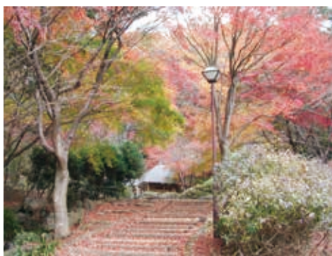
もみじで色づく民話館近くのあずまや