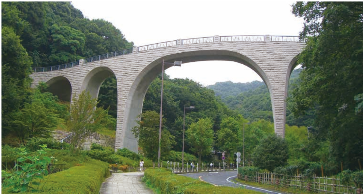
公園のシンボル 森のかけはし

厚木市西部に位置する全体が森林に覆われた広大な公園です。宅地開発に伴い保全された緑地を、公園として整備しました。園内には、バーベキュー場、アスレチック広場、森の民話館、森のアトリエなどの施設があり、森林浴プラスアルファの様々な活動を楽しむことができます。