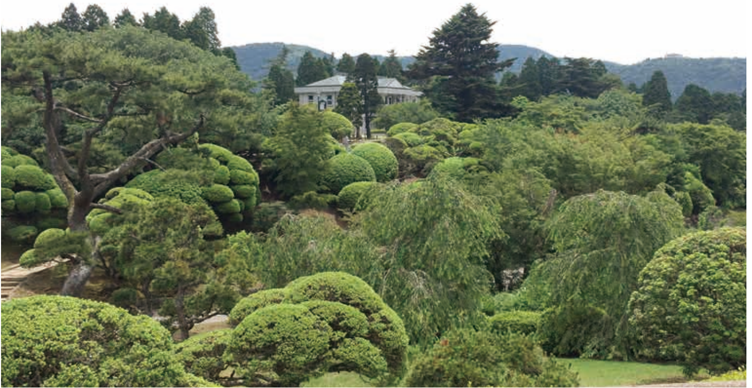
弁天の鼻展望台から見た庭園美

箱根の芦ノ湖南部に位置する離宮跡地につくられた公園です。明治時代に造営され震災により建築物が倒壊した箱根離宮は、戦後県に下賜され、公園として整備されました。園内には、離宮のデザインを模した湖畔展望館と、手入れされた由緒ある樹木が離宮時代の雰囲気を醸し出しています。