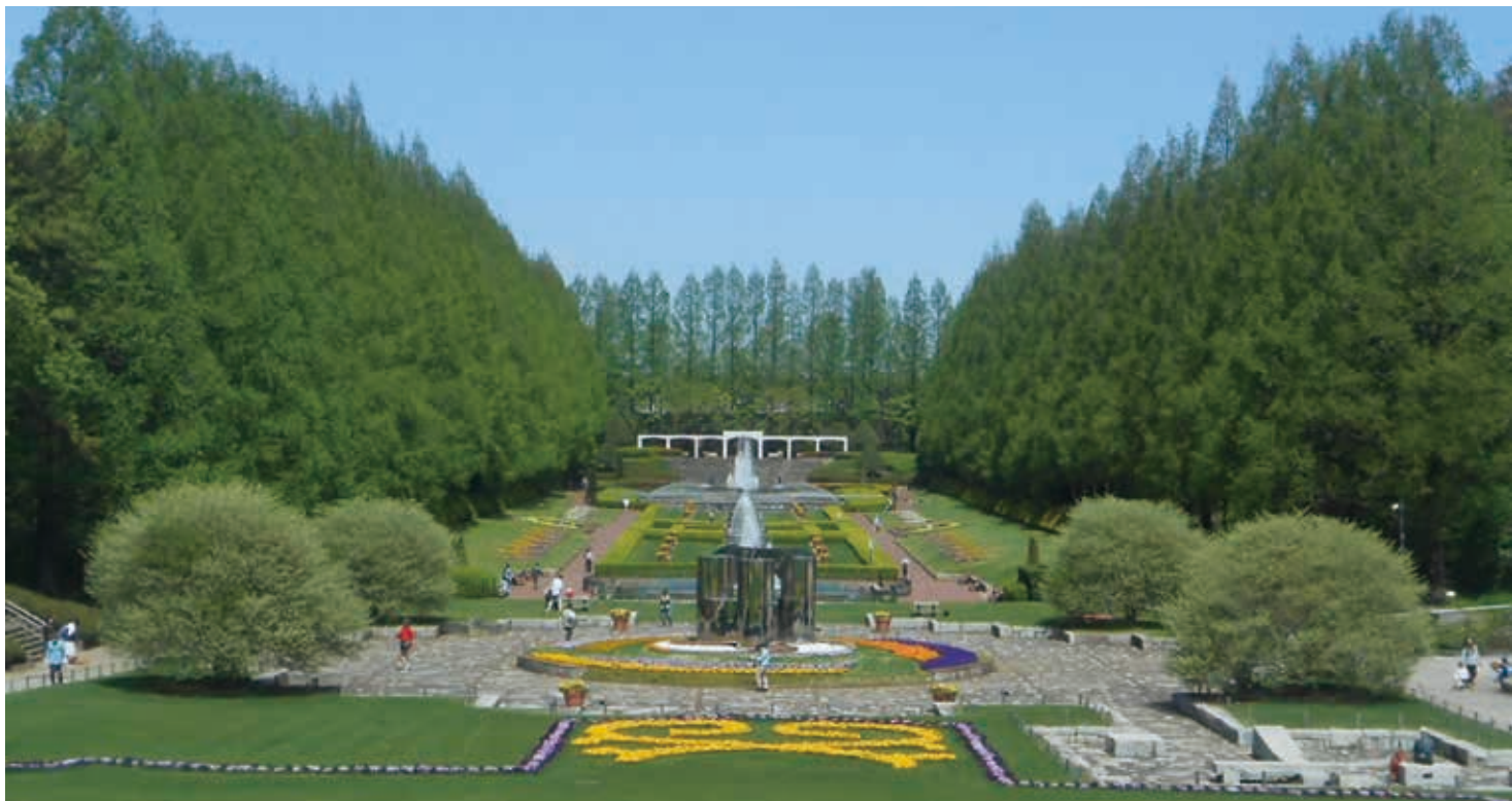
綺麗に整備された美しい噴水広場

相模原市の東部に位置する広大な芝生広場を持つ公園です。駐留軍や自衛隊の射撃場でしたが、廃止後の1970年代から公園として整備しました。園内には、大温室や菖蒲田、公園ナビステーションなどがあります。「人と犬がともに楽しめる公園」を目指しており、NPOが運営するドッグランも整備されています。