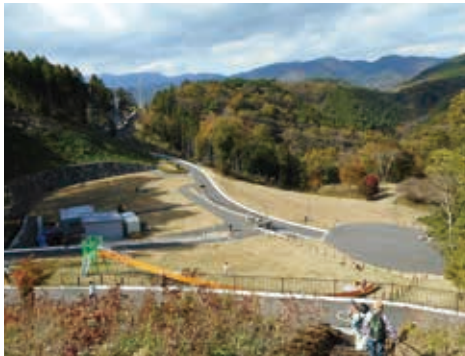
つつじ山展望広場から公園中心部