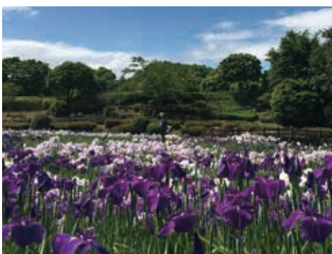
6月に咲き誇る水無月園（菖蒲田）