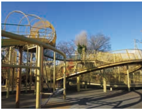
子供に人気の大型遊具