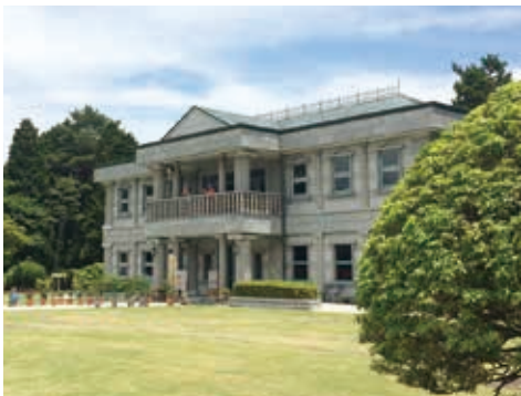
2階からの展望が素晴らしい湖畔展望館