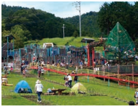
遊具がある冒険の森