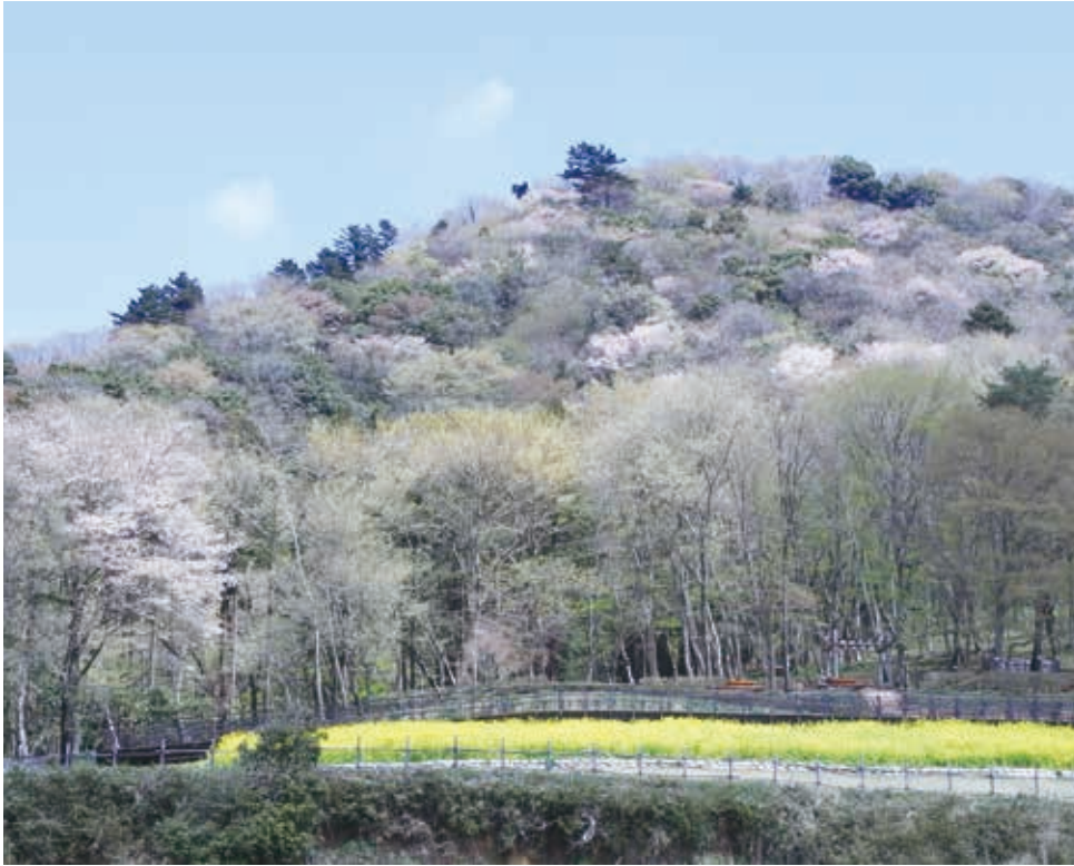
山桜で色づく春の城山

津久井湖畔にそびえる城山は県下最大級の中世の山城です。この城山を中心とする広大な敷地に「水の苑地」「花の苑地」「根小屋地区」などが開園しています。根小屋には江戸時代に代官所が置かれ、城山は幕府の御林として厳重に管理されていたことから、歴史と里山の自然が色濃く残されています。この公園では、地域の人たちと共に地域の文化的資源や自然資源の活用と保全への取り組みを進めています。