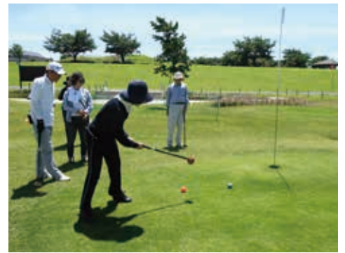
パークゴルフ場を備えたスポーツ広場