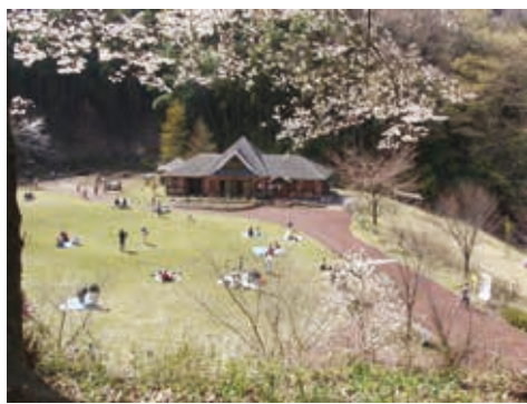
陶芸や木工などが体験できる森のアトリエ