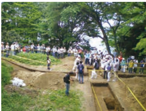
津久井城発掘調査見学会