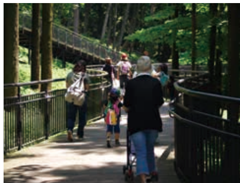
森の中を散策できるバリアフリー園路