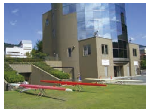
カヌーの手入れがされる艇の広場