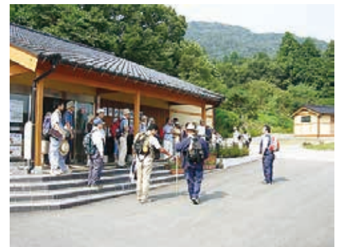
公園の玄関口、パークセンター