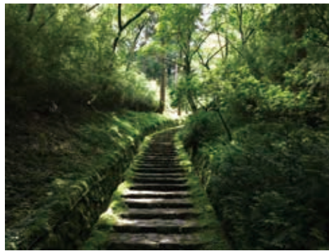
離宮時代を偲ばせる二百階段