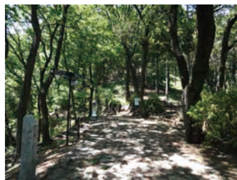
白山巡礼峠ハイキングコースともつながる