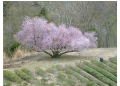
茶畑とマメザクラ