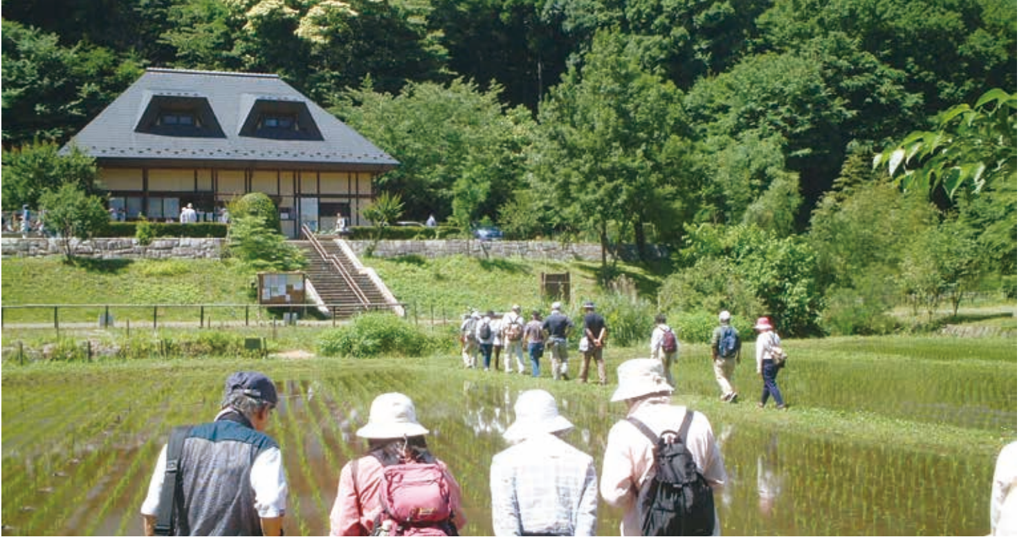
昔懐かしい里山の風景は、県民参加による田植えや稲刈りで保たれている

県の中央部、座間市に位置する谷戸の多様な自然環境を保全した公園です。全国初の自然生態観察公園(アーバンエコロジーパーク)として整備しました。園内には野鳥観察小屋やボランティア活動の拠点である里山体験館やパークセンターがあり、県民参加の管理運営に取り組んでいます。