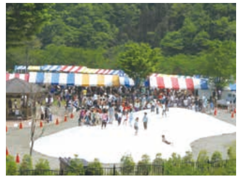
子供広場のふわふわドーム