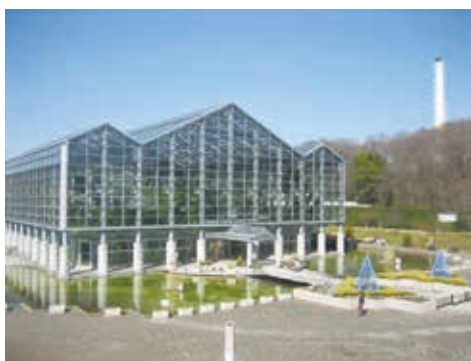
サカタのタネグリーンハウス（大温室）