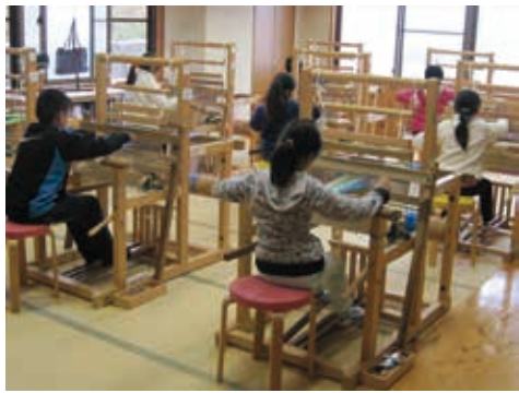
工芸工房村での機織り体験