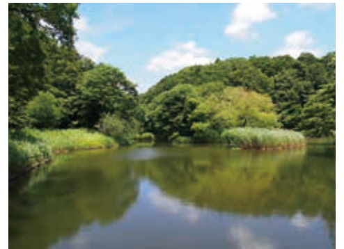
カモやカワセミが集まる水鳥の池