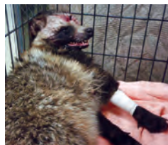
交通事故にあったタヌキ