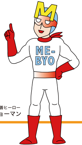
未病改善ヒーロー ミビョーマン