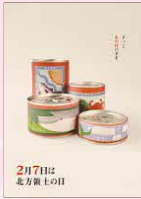
2025年度 最優秀賞（総合）