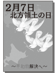
2025年度 最優秀賞（高校）