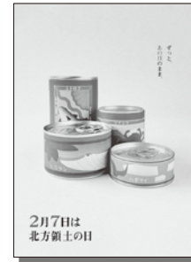
2025年度 最優秀賞（総合）

http://www.pref.hokkaido.lg.jp/sm/hrt/index.htm