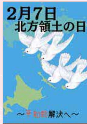
2025年度 最優秀賞（高校）