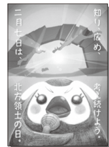
2025年度 優秀賞（大学・専門学校）

北海道デザイン協議会は、個人、産業、地域、社会、そしてよりグローバルな領域におけるデザイン活動の向上と活性化をめざし、北海道のデザインの可能性を信ずる人々の力を結集し、多様なデザイン活動を通じて社会への提案と啓蒙活動を展開する団体です。詳しくは、ホームページをご覧ください。 http://www.hda21.jp/