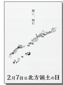
2025年度 最優秀賞（大学・専門学校）