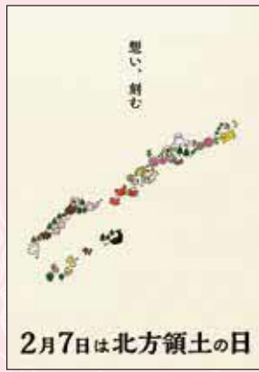
2025年度 最優秀賞（大学・専門学校）