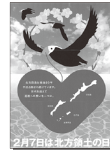
2025年度 優秀賞（社会人）