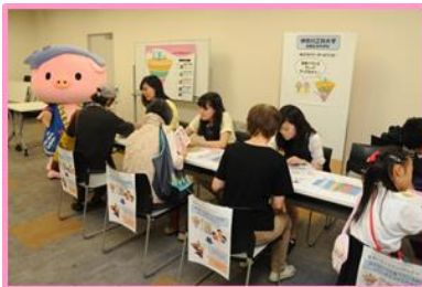
【体験コーナーの様子】

日時 平成 28 年 6 月 25 日（土）10：00～16：00 場所 あつぎ市民交流プラザ（アミューあつぎ）6階、アミューあつぎ9階 内容 「おいしく 楽しく 健康に」をテーマとして、楽しく食について学ぶ体験コーナー、生活習慣病予防等の展示、忙しい方向けの料理教室、フードスタイリストのマロンさんの講演会を開催。 【体験コーナー】参加者約 500 人（自由参加） 【料理教室】オトナのキッチン 参加者 23 人（市内在住 20 歳以上、事前申込） 【講演会】子どもと一緒に楽しみたい！「マロン流・食育講座」参加者 81 人（市内在住小学生以上、事前申込）