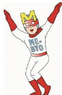
未病改善ヒーロー「ミビョーマン」

その中で重要な要素である「食」について、県民の皆様の健全な食生活の実践に向けて、関係者の皆様と共に食育を推進しています。