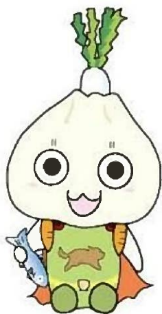
神奈川県の食育マスコット 「かなふう」