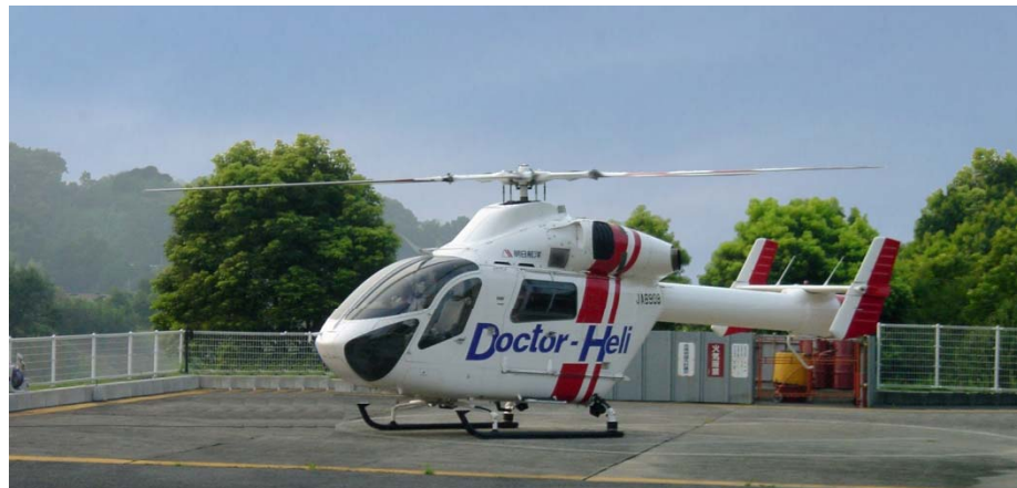
防災ヘリ・ドクターヘリ