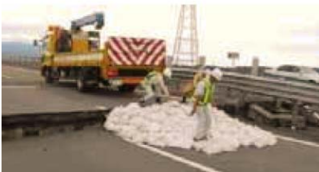
災害時の応急復旧