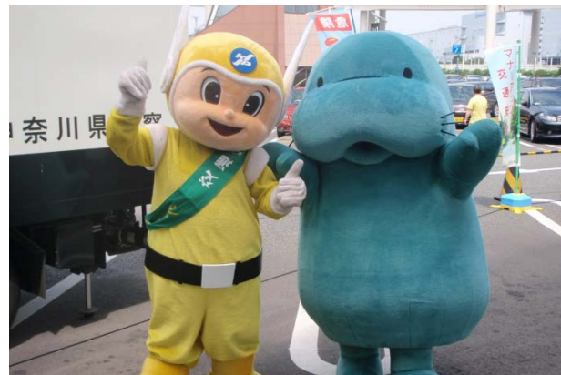
交通安全啓発活動