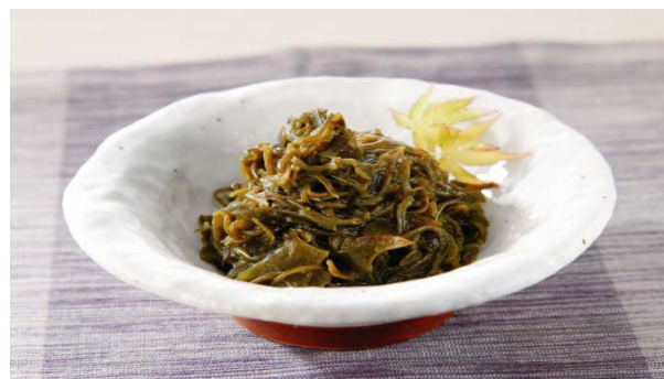
神奈川県産品の販売及び神奈川県産品を使用したメニュー (横須賀PA)