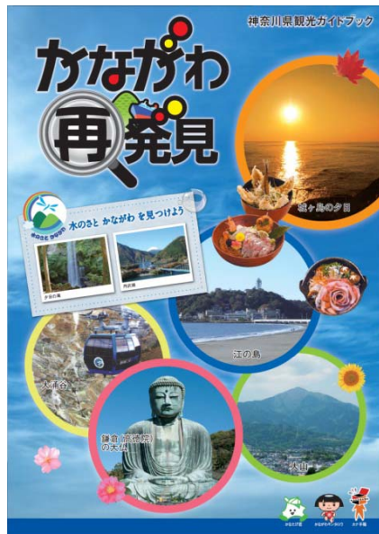
ポスター・パンフレットなど 観光情報の発信