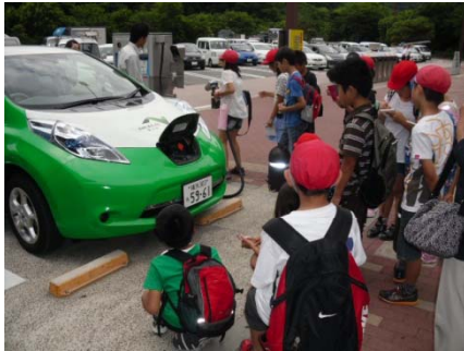
地域の小学生を対象とした環境学習会の実施 (横須賀PA)