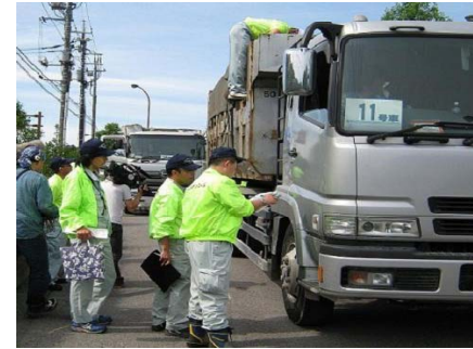
不法投棄に関する点検・指導 (イメージ)