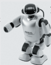
コミュニケーションロボット

富士ソフト株式会社 フランスベッド株式会社 株式会社エルエーピー 株式会社イノフィス RT.ワークス株式会社 マッスル株式会社