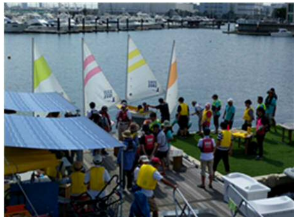
(海上体験会の様子)