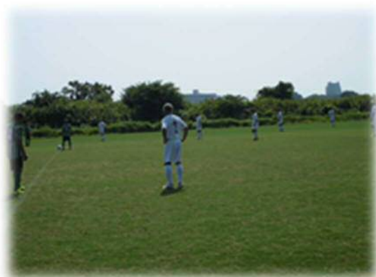
（ゆめかながわシニアフェスタ サッカー大会）