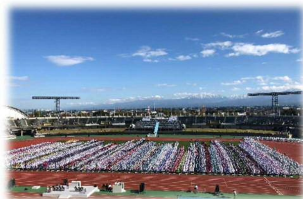
（ねんりんピック富山 2018 開会式）