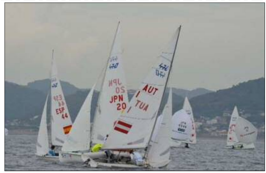
③セーリングワールドカップシリーズ江の島大会2018