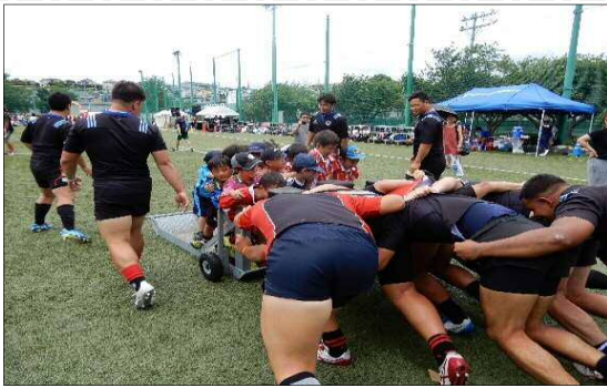
①子どものラグビー体験