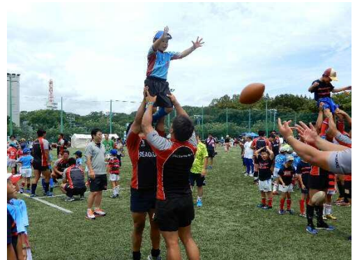
(ラグビー体験の様子)

(注2) 開催自治体においてラグビーワールドカップ開催を周知するための装飾や演出（看板、横断幕、のぼりの掲示等）。