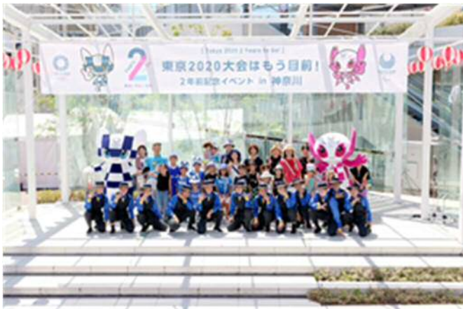
(2年前イベントの様子)