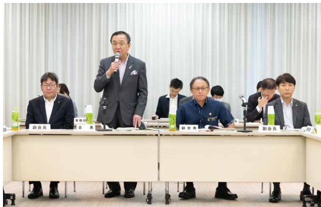
令和6年度定期総会(前列左から青森県副知事、神奈川県知事、沖縄県知事、長崎県副知事)