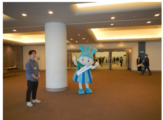
かながわ しずくちゃんの演出