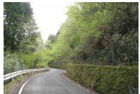
南足柄市と箱根町を連絡する道路の整備

新東名高速道路の整備促進や西湘バイパス延伸計画の促進、県道731号(矢倉沢仙石原)〔南足柄市と箱根町を連絡する道路〕や都市計画道路穴部国府津線の整備などの道路網の整備を進めています。また、スマートインターチェンジの整備促進など道路網の有効活用にも取り組みます。