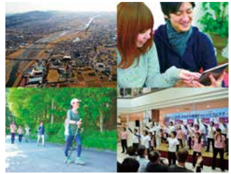
県西地域の地域資源を生かした活性化

県西地域の食や自然、温泉などの魅力を生かし、「未病を治す」をキーワードに、住む人や訪れる人の健康長寿をめざすとともに、地域の魅力を高めて新たな活力を生み出すため、県西地域活性化プロジェクトを進めています。