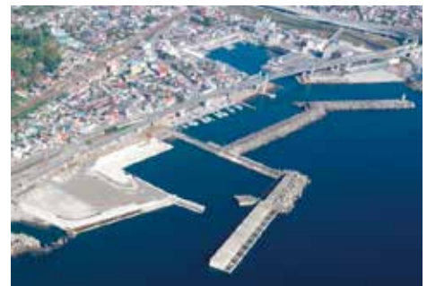
整備が進む小田原漁港

県営の小田原漁港は、県西地域の水産物生産流通加工拠点としての機能を確保するとともに、漁港の多目的利用を推進することにより都市住民との交流を促進し、地域振興を図るため、「特定漁港漁場整備計画」に基づき整備を進めています。