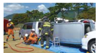
富士山火山三県合同防災訓練 (上:住民避難訓練、下:救出救助訓練)