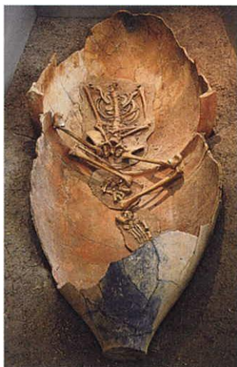
かめ棺に納められていた 首から上がない人骨