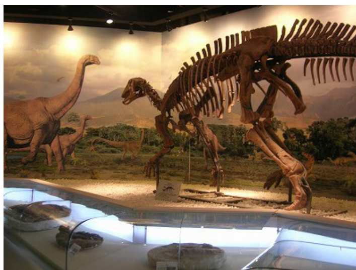
恐竜の骨格の展示もあり、見応え十分