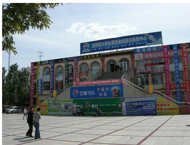
食堂や超市という購買が入っている建物です