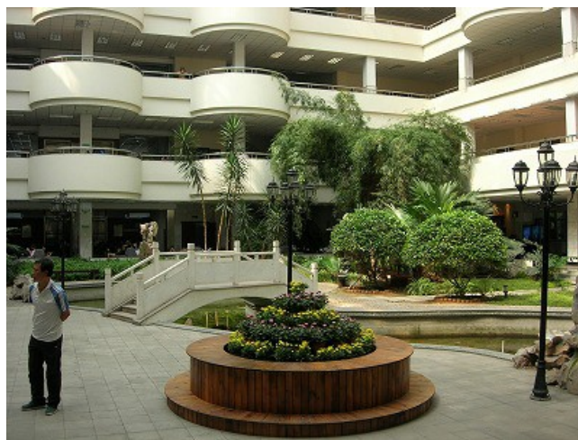
図書館内のラウンジスペース 池や橋があります

一部韓国料理があるほかはすべてが中華料理で、たいてい麺、餃子、肉まん、ご飯におかずをいくつか選択するものという品揃えです。