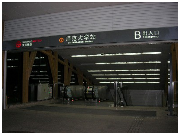
大学前の地下鉄駅