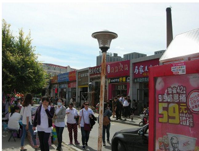
カフェや食堂が並んでいる通りです