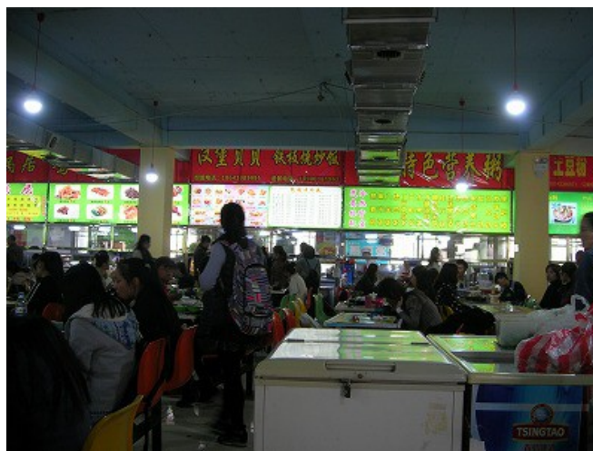
食堂内の様子 昼食時はいつも混雑しています