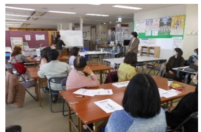
組織のリデザイン支援プログラムノウハウ移転事業

● 支援の対象となるボランティア団体は、事業受託者が公募、選定を行い、県の承認を得て決定します。