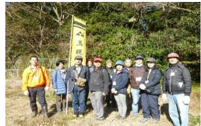
玉縄城の遺構群と文化財をボランティアで“守り、学び、次世代に伝える”活動の実施