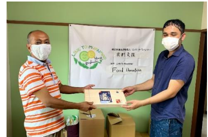
在日ミャンマー人のための定住支援事業と人材育成