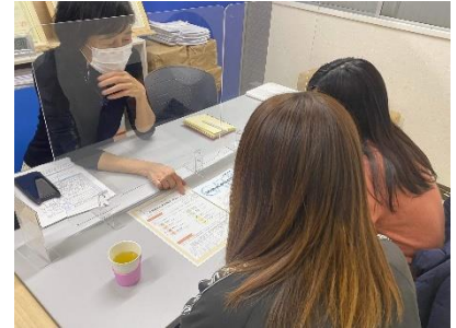
非対面でも実施可能な児童養護施設への就労支援普及活動

※ 年度ごとに審査があります。また、事業によって4年目以降（5年目まで）の継続を審査会で認める場合もありますが、その場合、別途事業計画（自立計画）の提出が必要です。