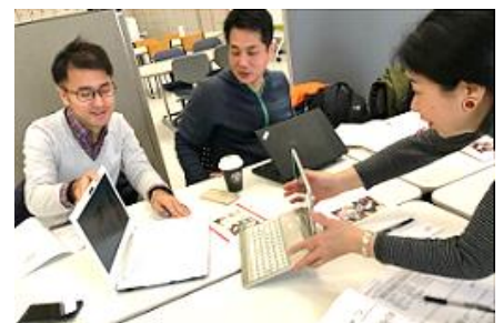
プロボノ・プラットフォーム展開事業

● 支援の対象となるボランティア団体は、事業受託者が公募、選定を行い、県の承認を得て決定します。