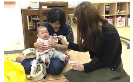
人材育成 仕事と子育て両立体験研修事業