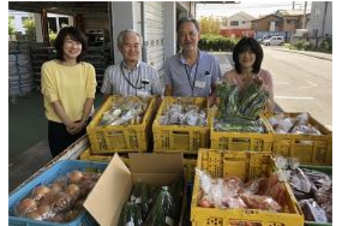
持続可能な食品循環の仕組みの構築

※ 年度ごとに審査があります。また、4年目以降（最長5年間）の継続を求める場合は、別途事業計画（自立計画）の提出が必要です。