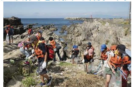
河川等のゴミ拾いや小学生向け環境出前授業等の実施