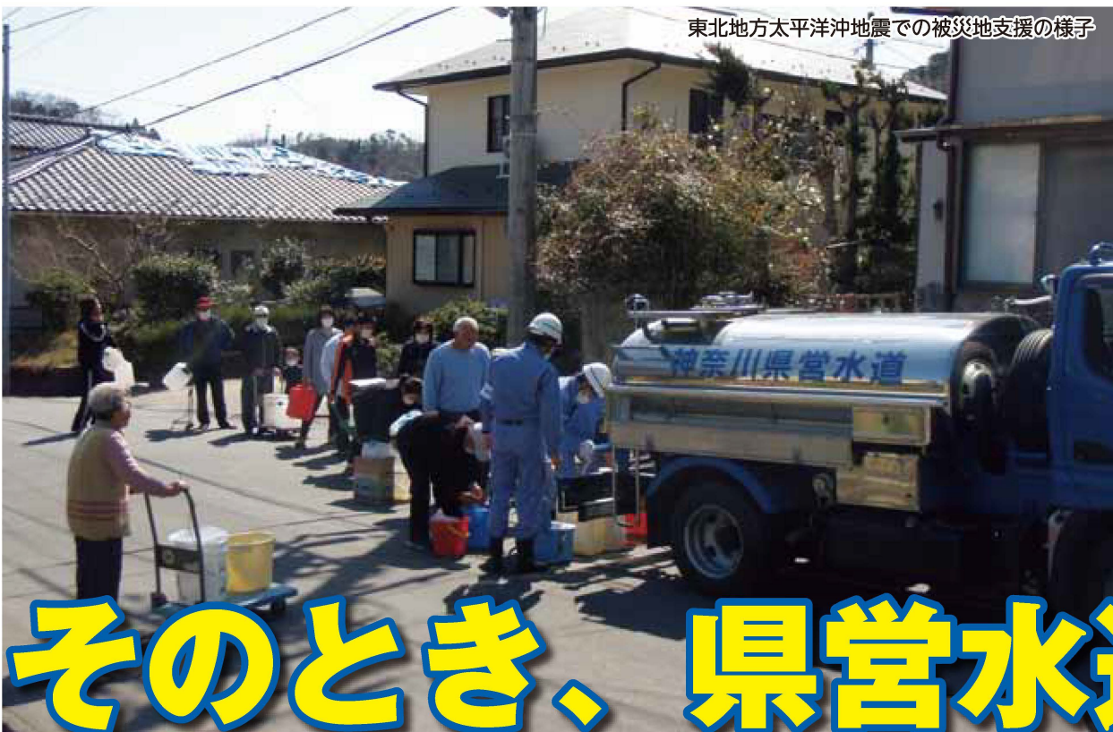
東北地方太平洋沖地震での被災地支援の様子

神奈川県モバイルサイト「かなぼけっと」神奈川県営水道のページ http://www.pref.kanagawa.jp/mbl/f100012/