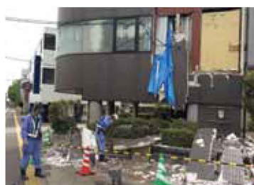
熊本地震における漏水調査状況