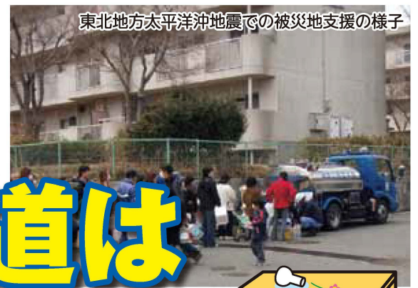
東北地方太平洋沖地震での被災地支援の様子