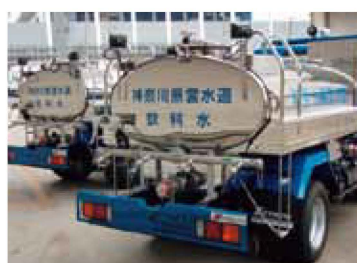
県営水道の給水車

平成28年熊本地震においても、漏水調査及び応急復旧工事などの支援を実施しました。