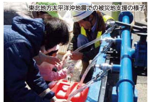
東北地方太平洋沖地震での被災地支援の様子