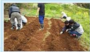
「農業体験」で働く体と心を。

⑤ 就職決定!! 定着・ステップアップ支援スタート。 就労後の悩みなど、継続的に支援を行います(1年間)。