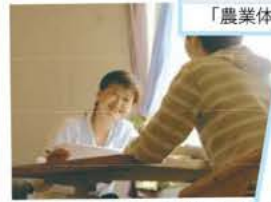
相談員が親身に対応します。