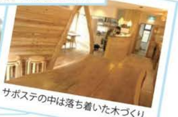
サポステの中は落ち着いた木づくり。