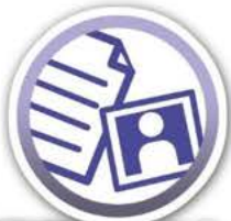
就職活動セミナー