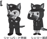
ジャンバード課部 シエリー課直

※イベント情報は、回覧板、地域広報誌のほか、お住まいの市町村の青少年行政主管課へお問い合わせください。