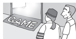
見守り・街頭補導活動