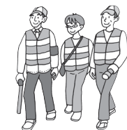
地域見守りパトロール

青少年指導員は、青少年に望ましい地域づくりを目的に活動を行っています。小学生が楽しめるイベントも開催していますので、ぜひご参加ください。