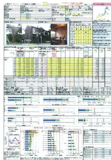
JIA環境シートサンプル