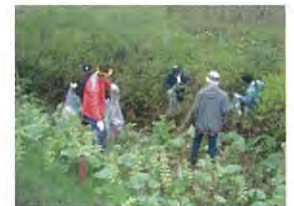
周辺環境もみんなでき綺麗に