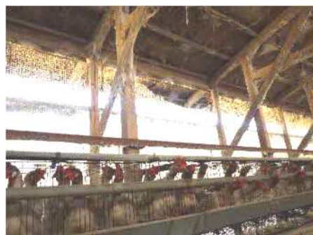
鶏舎側面の防鳥ネットの破損(農林水産省HPより)