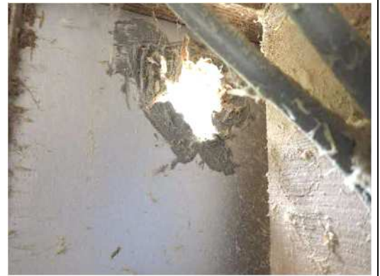
鶏舎の壁の穴