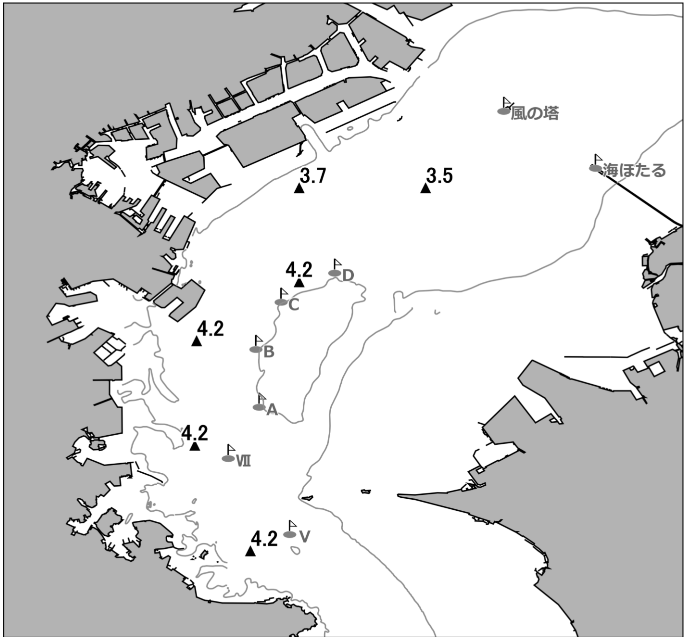
底層の溶存酸素量(ml/L) ※底層：海底上約 50cm