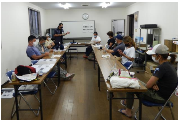
令和3年度「鎌倉ハマグリ部会」の会合