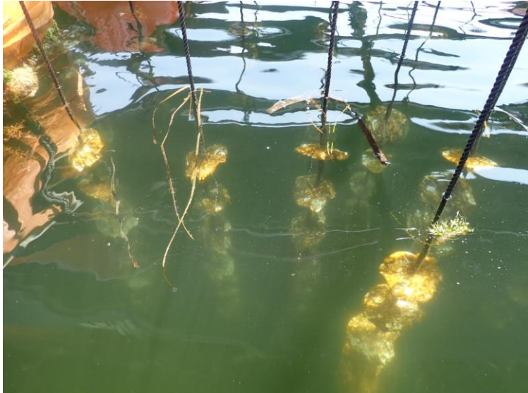
養殖筏に垂下されたカキの稚貝