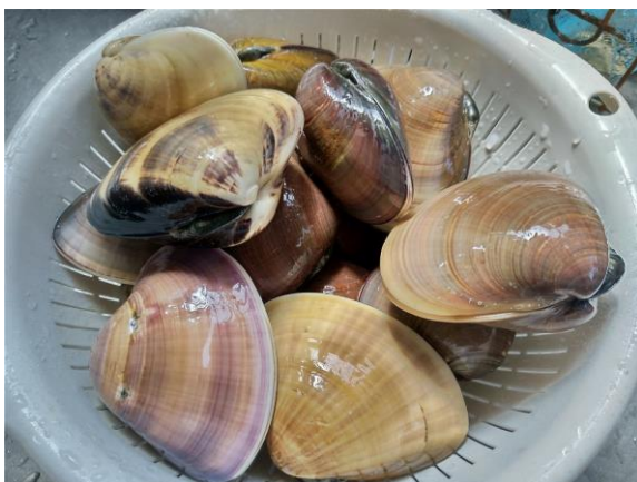
腰越の海で育った立派なハマグリ