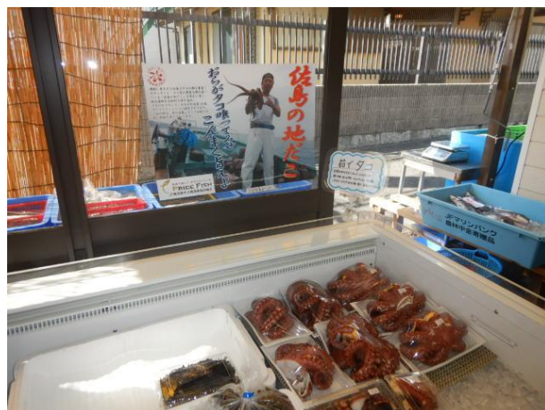
直売所にポスターを掲示