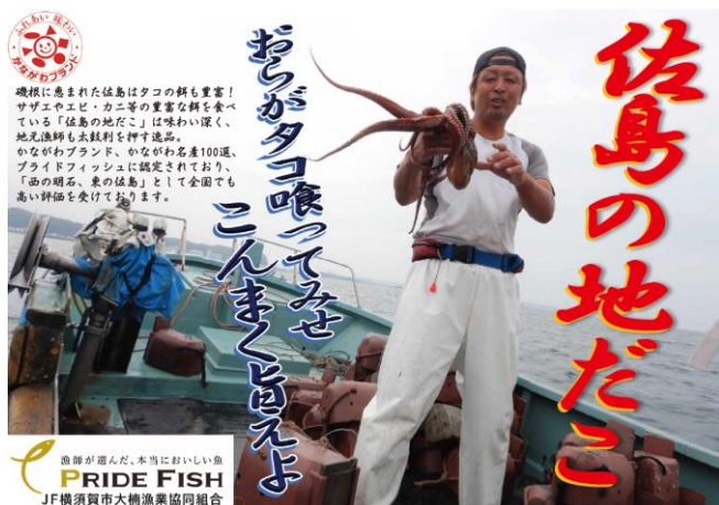
作成したPRポスター