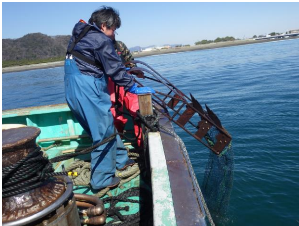
海底耕耘機の引き揚げ