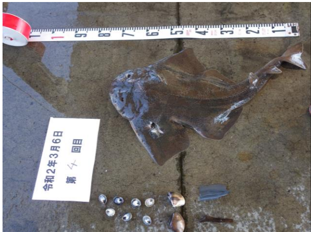
回収されたゴミや貝類等（魚はカスザメ）