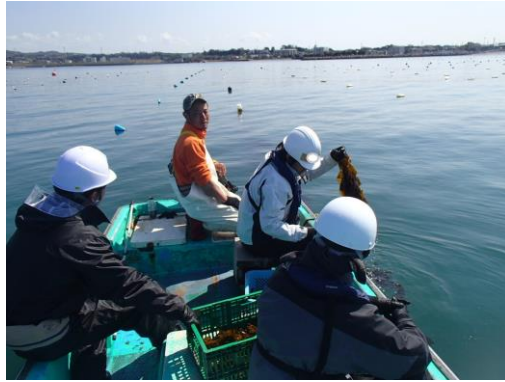
ワカメ収穫体験の様子