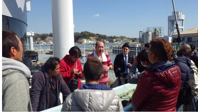
水産技術センターでの視察の様子