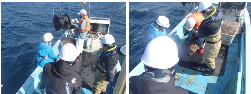
刺網体験の様子。ヒラメや大きなキアンコウが漁獲されました。