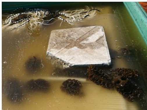
ワカメ種付け作業の様子