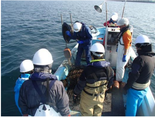
タコつぼ漁体験の様子