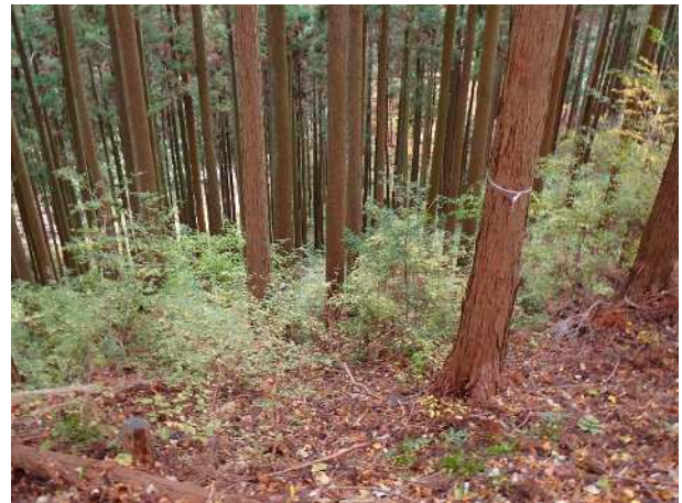
三廻部林道交点周辺

●栗ノ木洞山頂から表丹沢県民の森方面は、森林整備のため令和8年3月末まで通行止めになっていました。侵入すると作業の妨げになるだけでなくたいへん危険です。