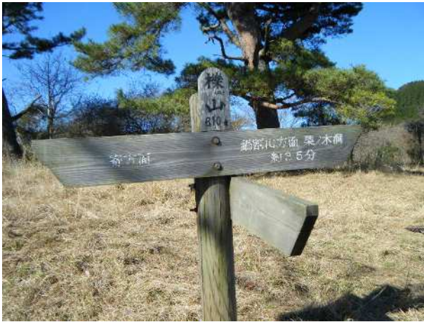
2011 年 12 月

●草原状に開けた櫟山山頂は、ススキなどが増えて以前とは違う雰囲気になっていました。