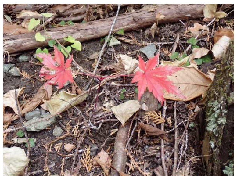
実生も一人前に紅葉していました