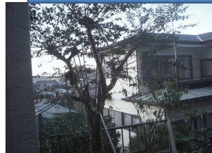
樹木の剪定作業の一例（百日紅）