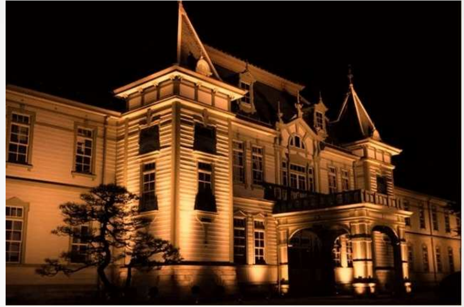
山形-旧米沢高等工業学校