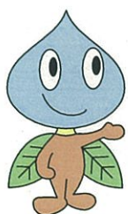
川崎市上下水道局 キャラクター 「ウォーターマン」