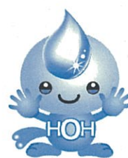
神奈川県内広域水道企業団 キャラクター 「ウォータービー」