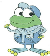
横浜市水道局 キャラクター 「はまびオン」