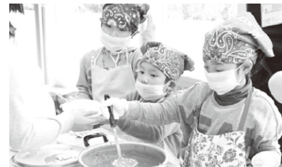
参加児童の労働体験の様子

ミニたまゆりは、2005年（平成17年）より開催しているドイツのミニミュンヘンの取り組みを参考にした5～15歳の子どもたちが参加できるキャリア教育イベントである。大学のキャンパス内に約70種類の仕事を用意し、子どもたちは、職業案内所（ハローワーク）で、行いたい職業を選ぶ。職業に就いた子どもたちは、学生スタッフから働き方を学び、労働体験を行う。