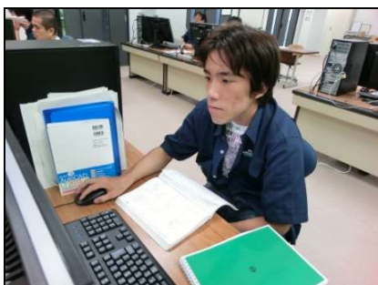
3次元C A D実習 (使用ソフト : Inventor)