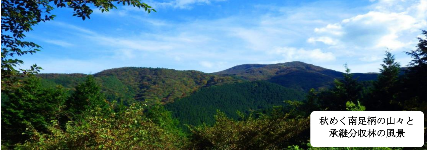
秋めく南足柄の山々と 承継分収林の風景

「承継分収林」は、かながわ森林づくり公社（平成22年4月解散）から神奈川県が引き継いだ分収林の名称であり、県ではかながわ森林再生50年構想を踏まえ、適正な管理及び整備を行うことにより、公益的機能の高い森林づくりに取り組んでいます。