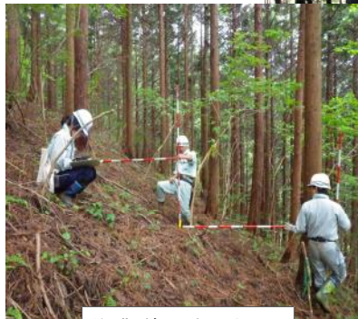
作業道調査・測量

業者へ発注後は、作業の指導や確認、完成検査等により、適切な整備が行われるよう図っています。