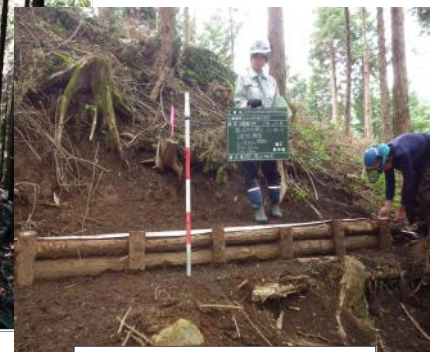
現採丸太筋工完成確認